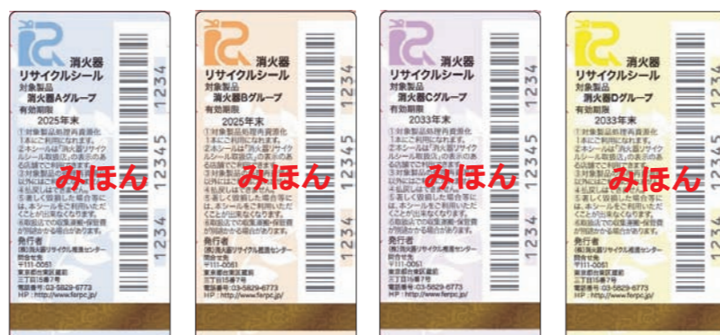
新品用リサイクルシール