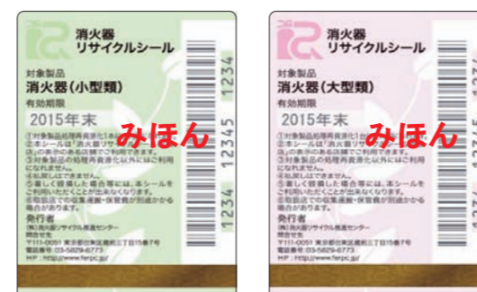
既販品用リサイクルシール