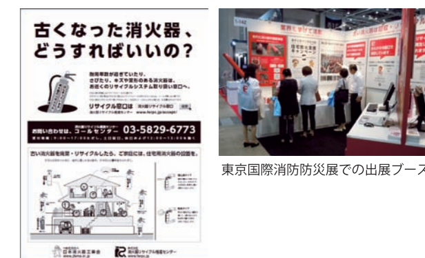
東京国際消防防災展での出展ブース