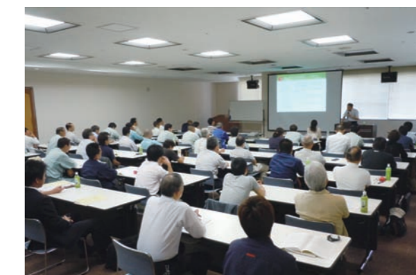
廃棄物実務者講習会の会場

また、定期的に20処理施設や指定引取場所に対する監査を実施するとともに、（一財）日本消防設備安全センターの協力を受け、全国すべての特定窓口を対象とした訪問調査を実施しています。